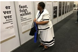
WPA Congress, Kapstadt