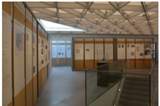
Centre Charlemagne, Aachen