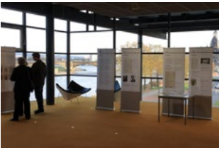
Sächsischer Landtag, Dresden