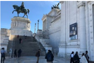
Vittoriano Rom