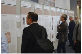
WPA Regional Congress in Osaka, Japan