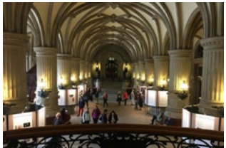
Rathaus Hamburg