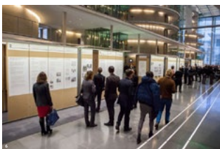
Bilder 1 bis 6: Eröffnung der Wanderausstellung im Deutschen Bundestag, Berlin Pictures 1 to 6: Opening of the travelling exhibition in the German Bundestag, Berlin, Germany