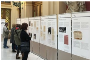
Bundesparlament, Wien