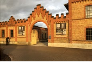
Gedenkstätte KZ Osthofen/Landtag Rheinland-Pfalz, Mainz